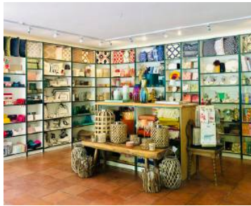
Im KWP findet man ausgefallene Geschenke.

BAD GASTEIN (red). „Wir bezeichnen unser KWP seit der Eröffnung im Jahr 2015 gerne als unser zweites Wohnzimmer“, ist Vanessa Golle stolz auf ihren „Café & Concept Store“ in der Kaiser-Wilhelm-Promenade in