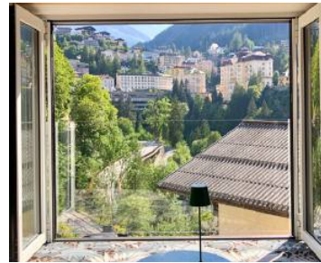
Der herrliche Ausblick auf Bad Gastein ist verlockend.

Der selektive KWP Café & Concept Store ist authentisch und verknüpft Gemütlichkeit mit Lifestyle Shopping. Hier genießen Gäste frisch gebackenen Kuchen zu italienischem Kaffee sowie ausgesuchte Biere und Weine. Je nach Saison kommen die Gäste in